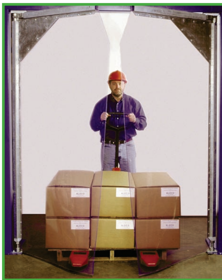
No incluye marco

que el modelo Supra gire sobre una superficie plana y pueda adaptarse para compensar la presión negativa o del viento. Los paneles se superponen 3" (7,6 cm) en la parte central para un cierre más eficaz.