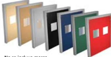
No se incluye marco.