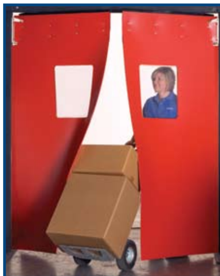
No se incluye marco.

La puerta Optima ImpacDor® de Aleco puede modificarse en el lugar de trabajo rápida y fácilmente debido a su exclusiva fabricación en una sola pieza.