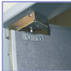
Sistema de bisagras EZ