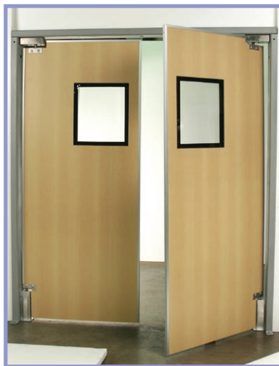
Se presenta con guardas de jamba opcionales

La FS-500 constituye la solución perfecta para las exigencias de uso en locales de comidas, comercios minoristas y la industria liviana, ámbitos donde se busca crear una barrera visual o atenuar la corriente de aire en accesos transitados. Los coloridos frentes ABS de 1/8" (3 mm) están unidos a una estructura sólida de 1/2" (13 mm), para resistir el paso de las cargas y aún así permanecer lo suficientemente livianas como para abrirse en forma ligera ante un tráfico intenso. Esta puerta versátil y atractiva se apoya en un sistema de bisagras EZ de fácil instalación que permite una apertura de 125 grados en ambas direcciones. El exclusivo mecanismo de "compensación del pivote" de esta bisagra asegura un funcionamiento suave y liviano que facilita la corriente de tránsito.